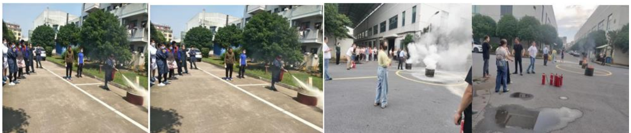
图 6.3-01 消防演练现场

公司每年举行消防演练和各种灾害应急演练。公司制订了《配电房火灾、爆炸应急预案》等应急预案、《触电事件应急预案》、《重大设备故障应急预案》等应急处置方案等，对火灾、机械、触电等均有相应的应急措施，并成立了应急指挥中心和应急救援专业组。